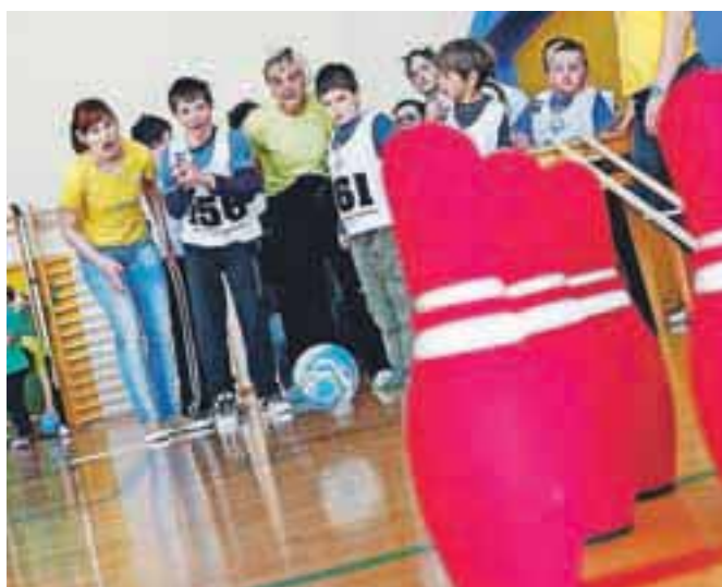
Športnega tekmovanja za najtežje gibalno ovirane se je udeležilo 44 mladih z vse Gorenjske.

V telovadnici OŠ Antona Janše v Radovljici so se konec maja v športnih igrah pomerili tudi mladi z najtežjimi motnjami v duševnem in gibalnem razvoju. Na tekmovanju, ki sodi v okvir Specialne olimpijade, je sodelovalo 44 tekmovalcev iz petih gorenjskih ekip: Sožitje Kamnik, OŠ Helene Puhar Kranj, Sožitje Radovljica, CUDV Matevža Langusa ter OŠ Antona Janše Radovljica. Pomerili so se na šestih postajah in sicer v udarjanju balonov, podiranju kegljev, metu na koš, brcanju žoge ter slalomu z vozíčkom oziroma hoji med klički ob upoštevanju prometnih znakov. M. A.