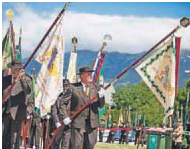
Prireditve se je začela s prihodom 88 praporščakov.