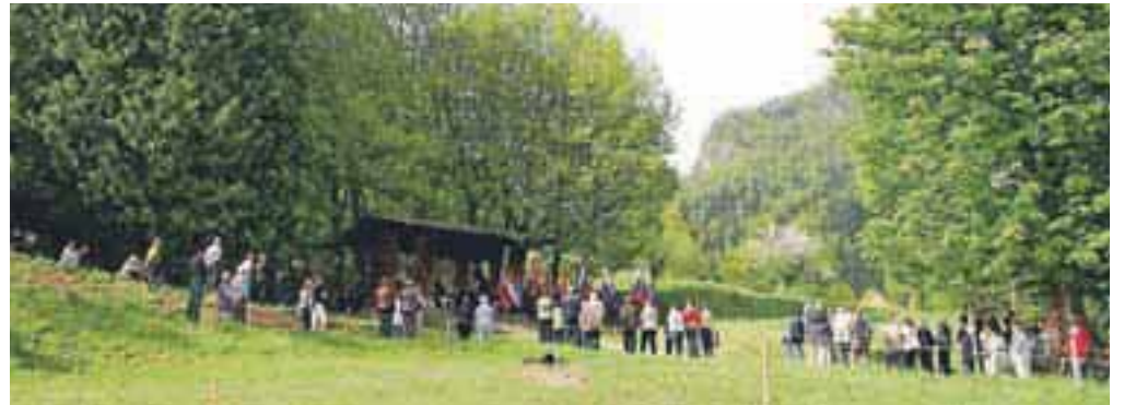
Osrednja slovesnost je bila tokrat pri Plečnikovi kapelici v graščinskem parku v Begunjah.

sti, Občine Radovljica, Komunale Radovljica in DRSC Ljubljana.