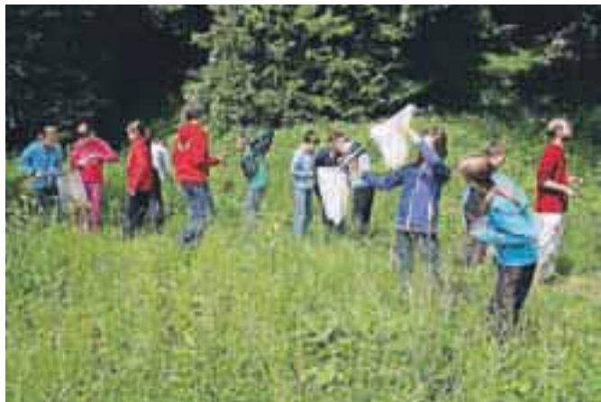
Med lovljenjem žuželk v Ljubljani