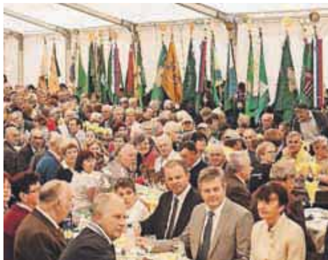
V Lescah se je zbralo tisoč čebelarjev iz vse Slovenije.