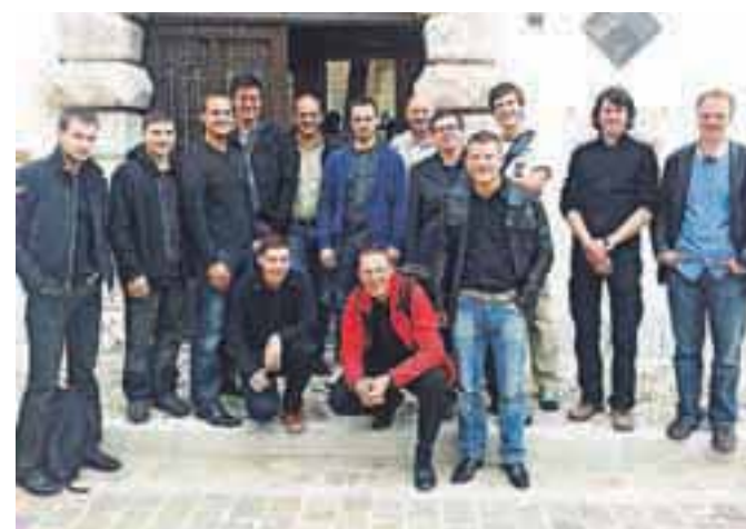
Člani Harmonikarskega orkestra Glasbene šole Radovljica in KUD Radovljica so v svoji najvišji kategoriji z zelo izbranim programom dosegli 94,8 točke od 100 možnih.