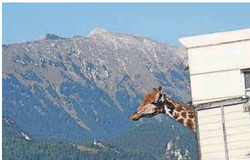
Fotografski natečaj Dogodki v občini Radovljica 2012: Skoraj tako kot v Afriki, avtor Štefan Žemva (diploma)

Z zvezdico (*) so označene prireditve v vstopnino. Več informacij o posameznih prireditvah je na voljo na spletni strani www.radolca.si/kaj-poceti/ . Dogodke za objavo v napovedniku pošljite po elektronski pošti na kaja.beton@radolca.si . Organizatorji prireditev si pridržujejo pravico do spremembe programa.