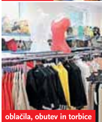
oblačila, obutev in torbice