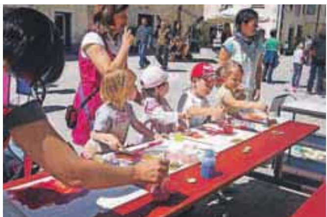
Otroci so risali, pletli in gnetli glino.

Priredili so delavnice pletenja s prsti, slikanje mokro na mokro, izdelovanje čarobnih vil, polstenje ovčk in različne otroške igre. Igrala sta jim Duo Terrafolk in Simbolični orkester. Otroci vseh starosti so v lepem sončnem vremenu ves dan risali, pletli, v palčkovem rudniku poiskali kamen, ki so ga položili v lastnoročno izdelan mošnjiček, gnetli so glino in jo oblikovali; skupinski izdelek je bil imeniten akvadukt, po katerem je na koncu celo tekla voda. Otroci so vstopili v pravljичni svet domišljije in doživeli imenitno izkušnjo igre in ustvarjanja z naravnimi materiali. Starši so preprosto uživali z njimi ter obenem dobili informacije o vpisu otrok v vrtec ter prvi in drugi razred waldorfske šole. I. K.