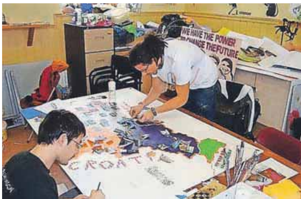
Takole se dva slovenska prostovoljca pripravljata na predstavitev naše države na Irskem.

Kot pravi, sodelujejo z mladinskimi organizacijami iz različnih evropskih držav. "Predlani je ena skupina prostovoljcev odšla na prostovoljno delo na Sardinijo, druga v Makedonijo. Lani se je v okviru projekta »I can go too« 5 naših prostovoljcev odpravilo na Irsko in trije znova v Makedonijo. Na Irskem so delali v mladinskem centru »St. Michael s Youth Project« V Dublinu, v