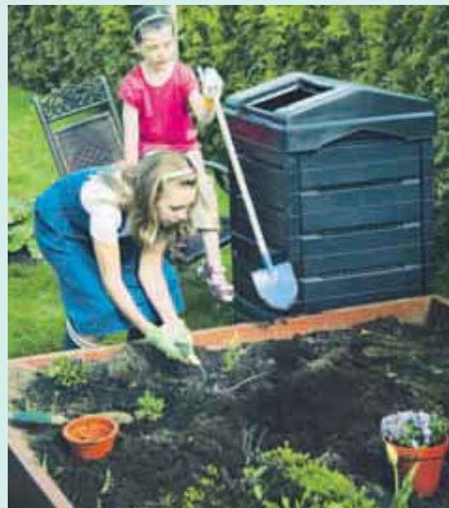
Kompostiranje – resno opravilo za zabavo

Kompost je zrel, ko ne ločimo več materiala, ko je celotna masa podobna zemlji in ima vonj po zemlji. Kompost navadno dozori v 12 mesecih po zlaganju, vendar ga je najbolje uporabiti naslednjo jesen. Primeren je za gnojenje vseh rastlin na vrtu, tudi za vrtno trato. Kompost na zelenjavnem vrtu enako kot hlevski gnoj zadelamo v zgornjo plast zemlje.