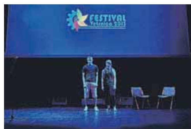
Festival Vetrnica je letos gostila Ekonomska gimnazija in srednja šola Radovljica.