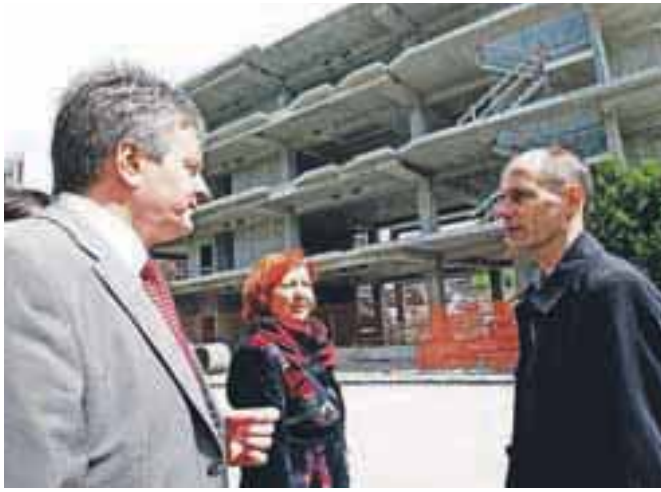
Minister za kulturo Uroš Grilc si je ogledal gradbišče nove knjižnice.