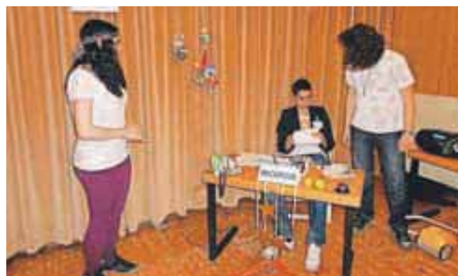
Tokrat so dogajanje postavili v hotelsko recepcijo.

»Prva predstava, ki smo jo pripravili, je govorila o šolskih dogodivščinah, druga o zabavnem popotovanju z vlakom, decembra lani pa so svoje ideje predstavili z vodenjem osrednje slovesnosti ob praznovanju 30-letnice CSD Radovljica. Uspešen nastop pred širšim občinstvom in pomembnimi gosti je mlade spodbudil, da so se takoj lotili novega ustvarjanja. V spomladanskem času so ponosni na premiero povabili starše, prijatelje ter zanje pomembne osebe. Tokrat so dogajanje postavili v hotelsko recepcijo. Predstava »Hotel šest zvezdic pa dva japka« je preplet različ-