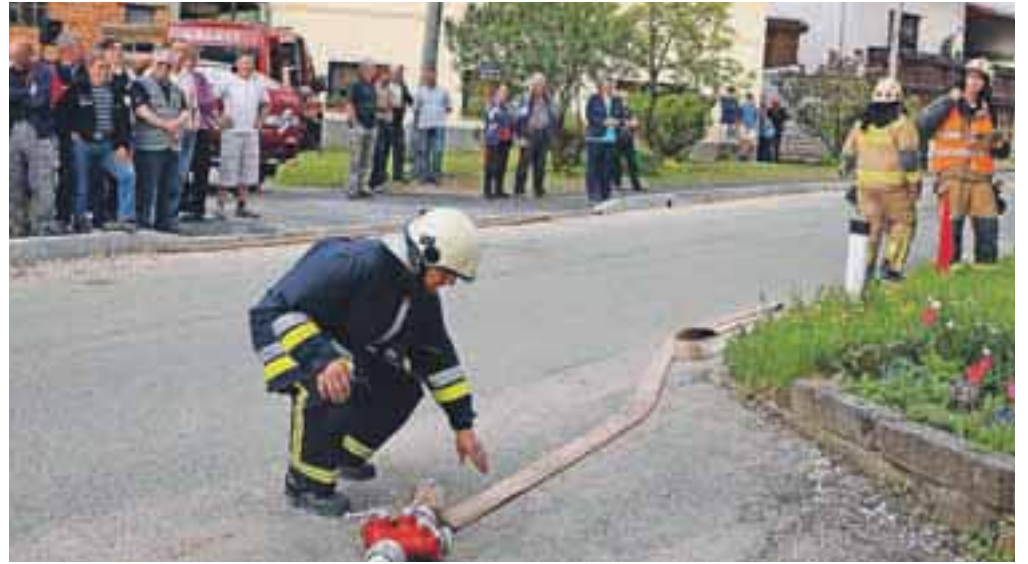
Krajani so gasilsko vajo lahko opazovali kar z novega pločnika v Poljčah.