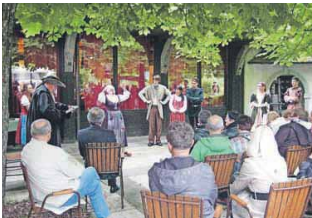
Linhartov oder je na vrtu gostilne Kunstelj uprizorili igro z naslovom Sodi se pregreham strine Porcijunkule.

čil, da bi kadarkoli kasneje načrtovalci posegli v sam park. Na ta način ga je ohranil, mi pa bi mu lahko, če bi pod njim zgradili parkirišče in ga obnovili, dali neko novo vrednost. Na drugi strani gre za nadaljevanje nekega novega konteksta tudi na kopališču v Radovljici. To je bilo v času svojega nastanka eno najmodernejših v Sloveniji in mislim, da se projekt, ki se trenutno pripravlja za njegovo prenovilo, približuje temu cilju. Dejstvo je, da je arhitekt Vurnik že tedaj izbral lokacijo, ki je bila zaščiten. Zagotovil je gretje vode s sončno energijo, danes pa je to-