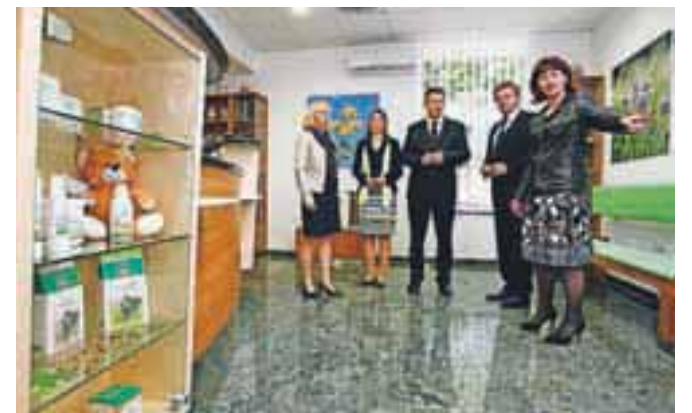
V obnovljeni lekarni je več prostora in več časa za delo s strankami.